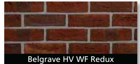
Belgrave HV WF Redux