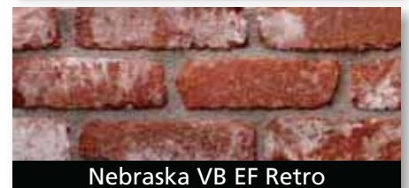
Nebraska VB EF Retro