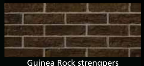
Guinea Rock strengpers