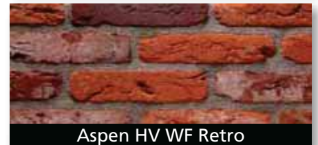
Aspen HV WF Retro