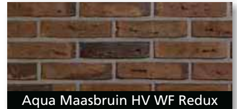
Aqua Maasbruin HV WF Redux