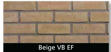
Beige VB EF